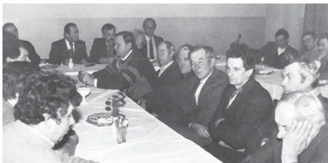
Święto sołtysa z 1991 r.