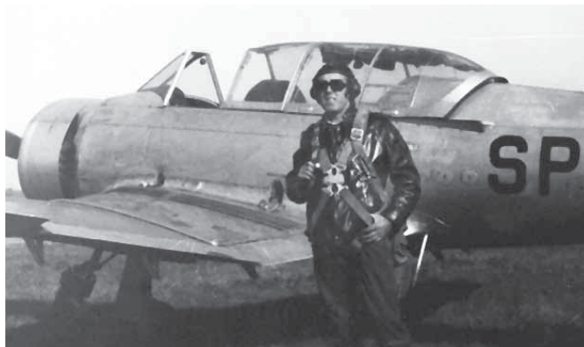
Przy TS-8 Bies, szkolenie pilotów samolotowych na obozach LPW – Łódź 1971 r.