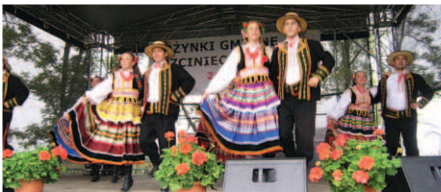
LZA „Serock” w czasie dożynek w gminie Pułtusk

Stroje krzczonowskie, obok krakowskich, są na „wyposażeniu” Ludowego Zespołu Artystycznego „Serock” w Serocku, bardzo prężnej, również pod względem kultury, nadnarwiańskiej gminie z miasteczkiem Serock. Co ciekawe, mimo iż Serock graniczy z regionem kurpiowskim, to jednak artyści z serockiego LZA nie sięgają do tradycyjnej skarbnicy Kurpi. Dlaczego? Kurpie byli ludźmi ubogimi, a więc ich ubiory, choć oryginalne, były skromne – gdy stroje lubelskie są bogate, barwne w hafty