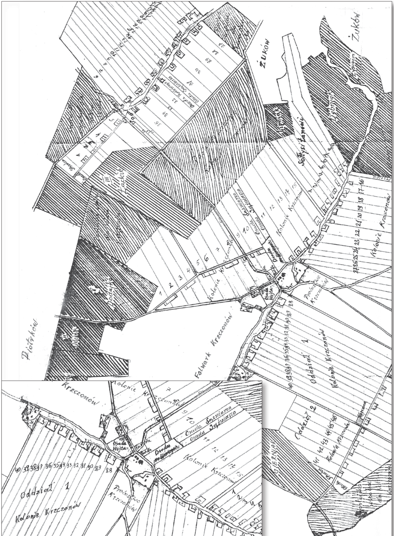
Centrum Krzczonowa z w/w planu