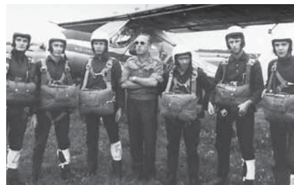
Spadochronowe Mistrzostwa Pomorza – Bydgoszcz 1964 r.