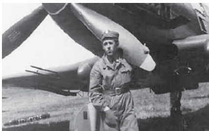
Ił-10, służba wojskowa 4 PLSz w Modlinie, jako strzelec pokładowy – 1953 r.

Urodziłem się 15 lipca 1932 roku w Krzczonowie k. Lublina. Tu też skończyłem szkołę podstawową. W lipcu 1948 roku zgłosiłem się ochotniczo na wakacyjny turnus hufca pracy „Służby Polsce”, gdzie pracowałem przy odbudowie zniszczonych podczas wojny torów kolejowych na odcinku Hrebennie – Sokal. Za dobrą pracę otrzymałem medal i stopień starszego hufcowego, a także propozycję udziału w kursie na pilota szybowcowego. Zafascynowany możliwością latania w przyszłości na samolotach, postanowiłem wykorzystać taką okazję. Po weryfikacji i dokładnych badaniach lekarskich, jesienią 1949 roku zostałem wysłany na teoretyczny kurs szybowcowy do Szkoły Szybowcowej na lotnisku Lisie Kąty koło Grudziądza. Kurs ukończyłem z wynikiem bardzo dobrym i w marcu 1950 r. znalazłem się na szkoleniu praktycznym w Szkole Szybowcowej w Fordonie koło Bydgoszczy. Tam wykonując loty na szybowcach SG-38, Salamandra i Jezyk, w maju uzyskałem tytuł pilota szybowcowego III kl. Po kursie w pełni szczęścia wróciłem do rodzinnego Krzczo-