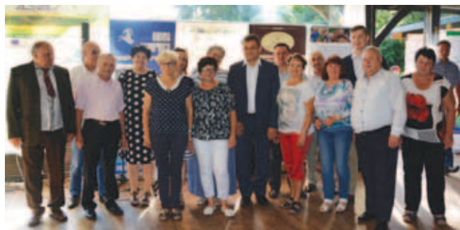
Piknik Sołtysów w 2017 r.