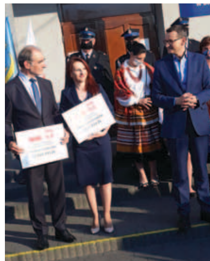
Wręczenie promesy od Premiera RP

W: W obecnej sytuacji – tylko zdrowia. Stworzyłam zespół fachowców, z którymi mam przyjemność współpracować, wobec tego nie boję się czynić śmiałych planów i podejmować trudnych wyzwań. Mam pewność, że uda się je z sukcesem zrealizować. Dziękuję za rozmowę. Całej redakcji „Krczonowskiego Gościńca” oraz mieszkańcom przesyłam życzenia zdrowia i pomyślności w nadchodzącym roku.