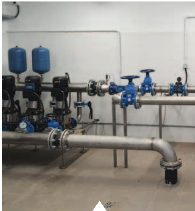
Budowa, przebudowa (modernizacja) wodociągu w miejscowości Krzczonów Wartość ogółem: 5 680 124,53 zł Dotacja: 2 951 000,21 zł Długość odcinka: 19,5 km