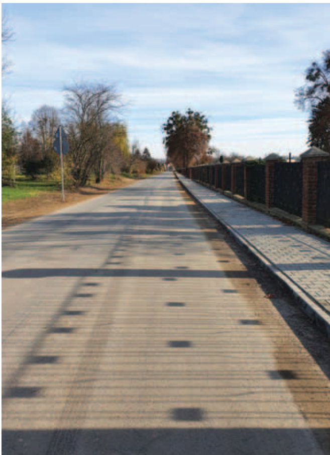
Przebudowa drogi gminnej w miejscowości Krzczonów, ul. Partyzantów Wartość ogółem: 714 535,82 zł Dotacja: 357 267,00 zł Długość odcinka: 1,229 km