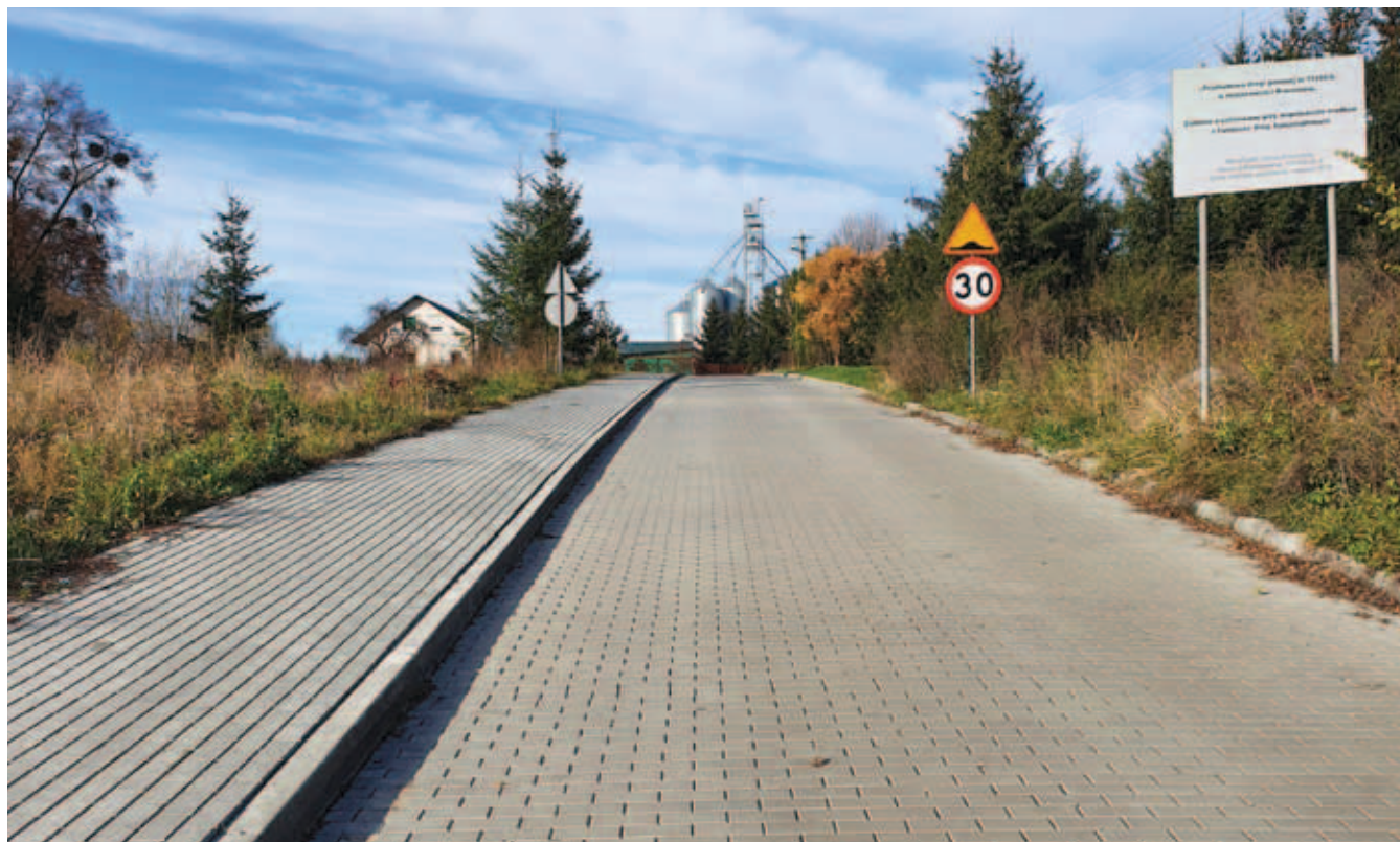
Przebudowa drogi do przedszkola Wartość ogółem: 239 000,00 zł Dotacja: 119 500,00 zł Długość odcinka: 0,125 km