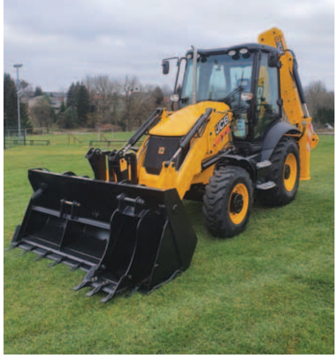
Zakup koparko-ładowarki Wartość ogółem: 360 390,00 zł