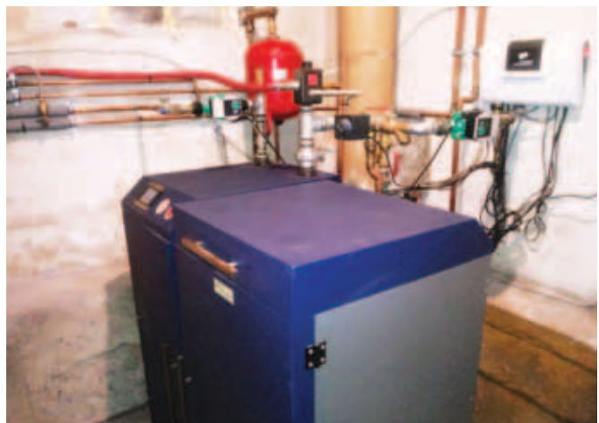
Dotacja z programu „Czyste Powietrze” – wymiana źródła ciepła oraz termomodernizacja indywidualnych budynków mieszkalnych Całkowita wartość projektów: 1 129 298 zł Dofinansowanie: 767 788 zł