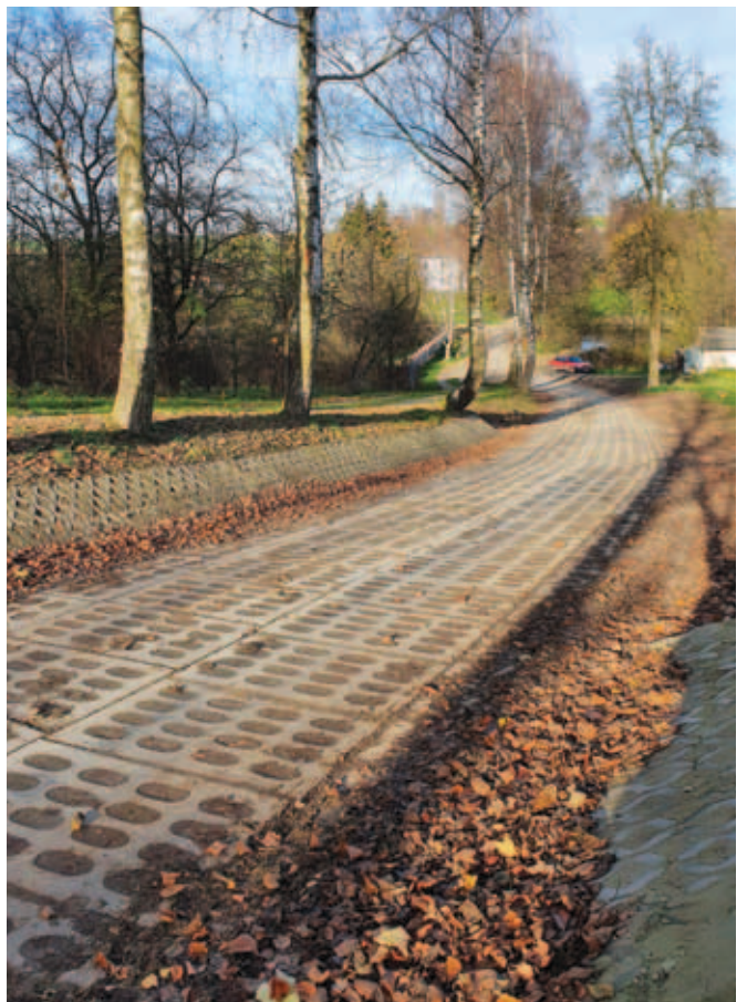
Modernizacja drogi dojazdowej do gruntów rolnych w Koszarzynie Dolnym Wartość ogółem: 143 536,13 zł Dotacja: 78 000,00 zł Długość odcinka: 0,204 km