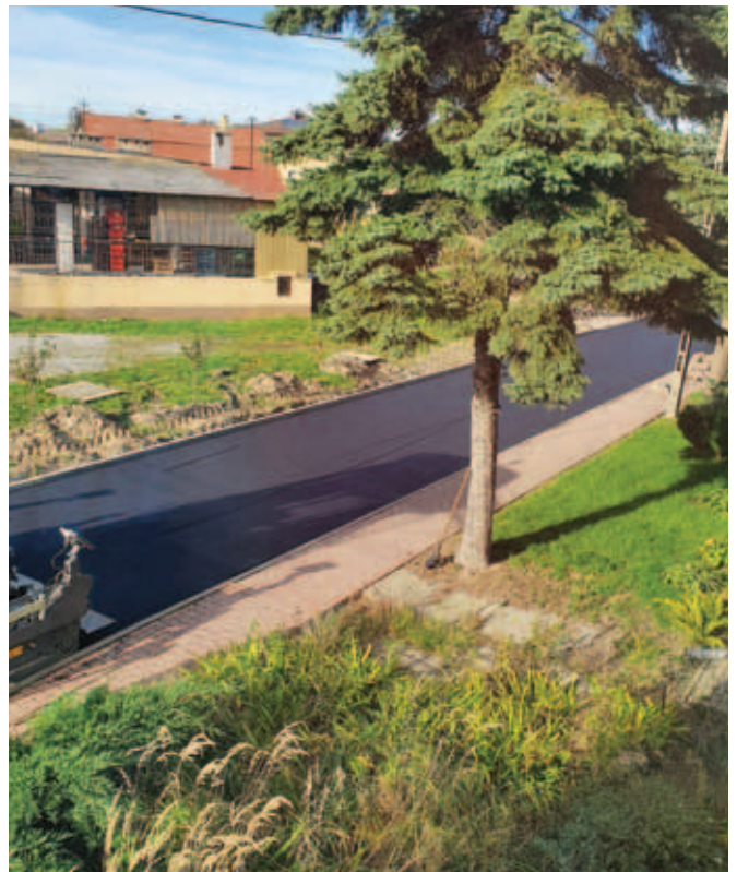
Przebudowa drogi wewnętrznej w miejscowości Krzczonów, ul. Spokojna Wartość ogółem: 40 753,59 zł Dotacja: 20 376,00 zł Długość odcinka: 0,118 km