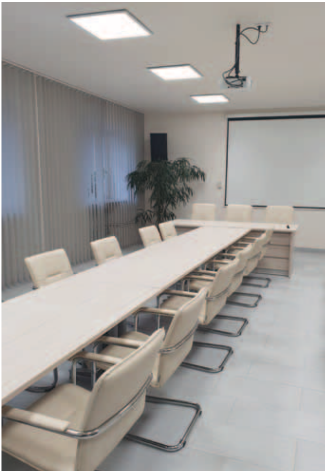
Remont i wyposażenie sali konferencyjnej w Urzędzie Gminy Krzczonów Wartość ogółem: 42 000 zł