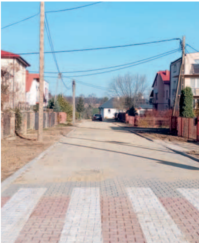
Przebudowa ul. Świerkowej w miejscowości Krzczonów Wartość ogółem: 179 590,96 zł Długość odcinka: 0,106 km