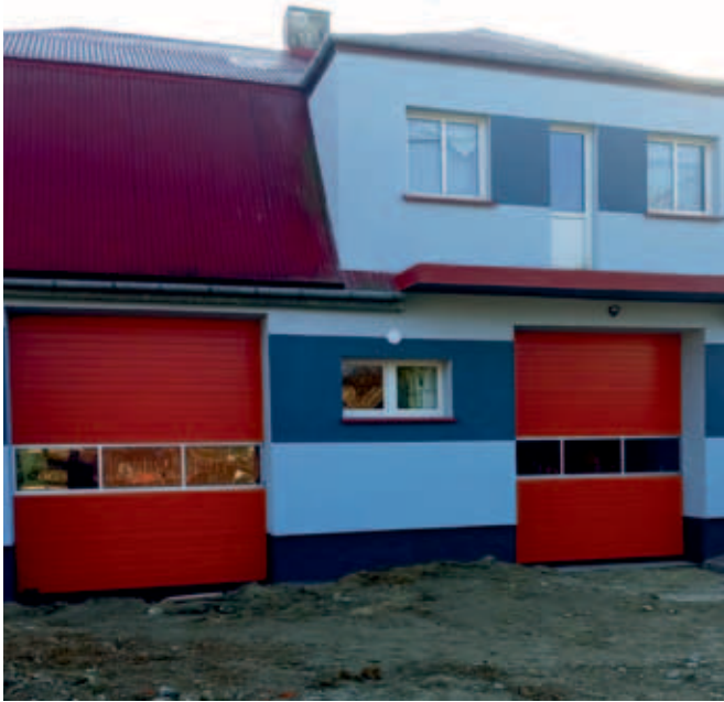
OSP Krzczonów w trakcie remontu Wartość ogółem: 241 034,96 zł Dotacja: 182 437,78 zł