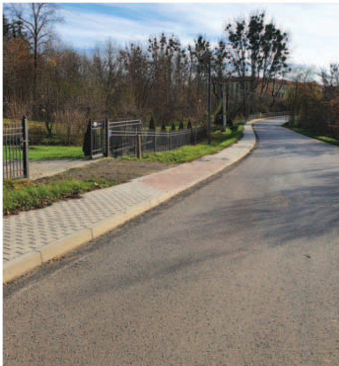
Budowa chodnika przy ul. Szkolnej w Krzczonowie Wartość ogółem: 131 000,00 zł Dotacja: 52 400,00 zł (wkład Powiatu Lubelskiego) Długość odcinka: 0,500 km